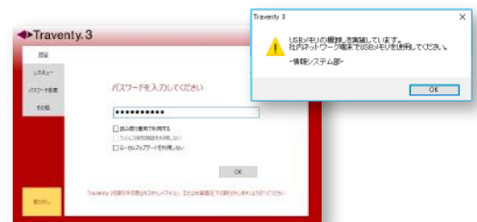
棚卸し期間になると利用者に棚卸しを促すメッセージが表示される