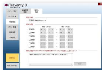
管理者ツールによる棚卸し機能設定